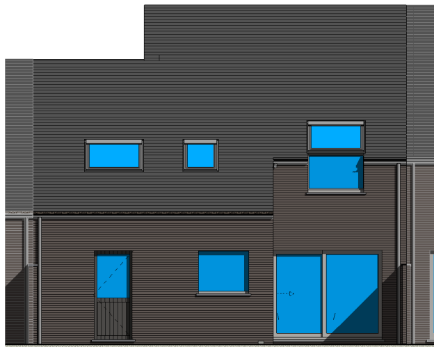
③ Façade arrière 1 : 50