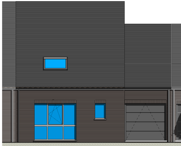
① Façade principale 1 : 50